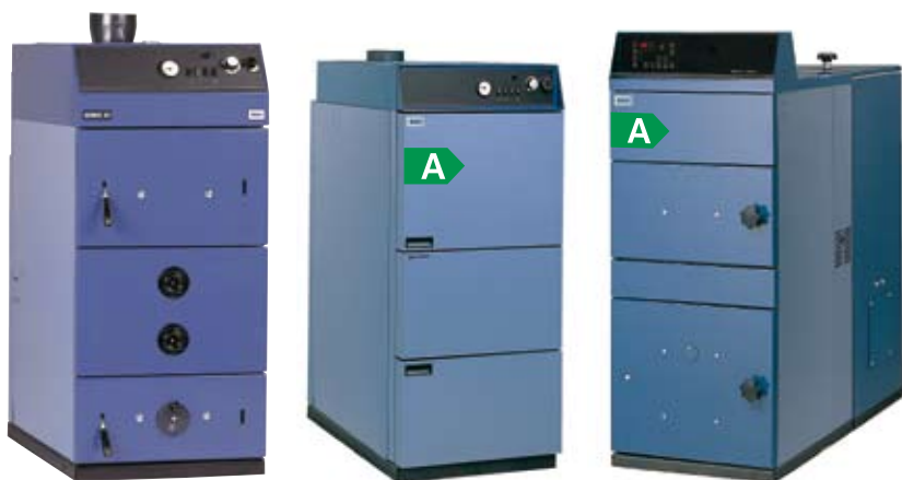
Bonus Fastbrændsel Træpiller

Ved fyring med pille-brændsel opnår du den laveste pris per varmenhed (kWh). Pillefy og stokerfy er specielt fordelagtige ved opvarmning af større boliger.