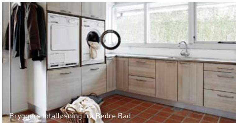
Bryggers totalløsning fra Bedre Bad

Et hold håndværkere gik i gang med at rydde det gamle fyrrum, og de brune fliser fra 70'erne måtte, sammen med den gamle upraktiske oliekedel, sige farvel til deres hjem gennem mere end 30 år. Ind rykkede i stedet ny-malede vægge, lyse fliser på gulvet, skabe til opbevaring, nye lamper og en lækker bordplade med vask. Det eneste, der ikke blev ændret, var rummets størrelse, selvom det nu både føles og synes meget større. Naturgasfyret sidder diskret og bruger hverken gulv- eller vægplads af betydning.