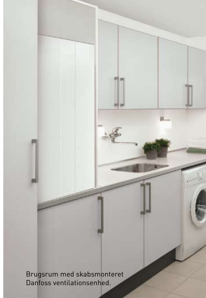
Brugsrum med skabsmonteret Danfoss ventilationsenhed.

Boliger er forskellige – det er behovene for energiløsninger også. Sådan lyder vores udgangspunkt, når vi rådgiver dig og din familie om jeres muligheder for at spare penge på den miljørigtige måde. Kontakt os, hvis du vil have gode råd fra din fagmand. Som din lokale fagmand kender vi til de energiløsninger, der vil klæde din bolig bedst. Vi er altid i nærheden, når du trænger til at få efterset fyret eller vil høre om mulighederne for at spare penge, skåne miljøet og få bedre komfort i boligen. Kontakt os og hør nærmere.